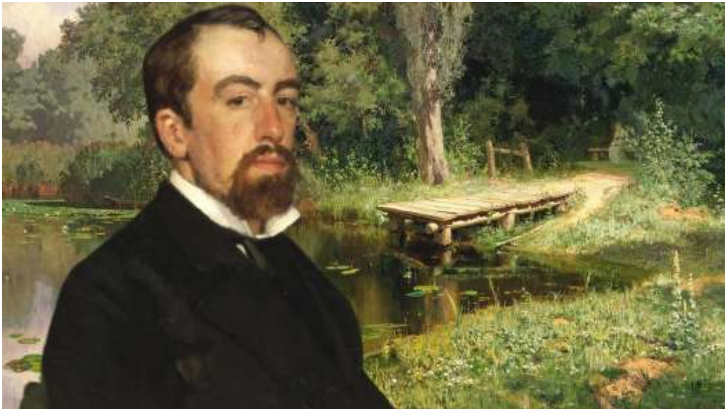
1920 — Давид Самойлов , российский поэт.